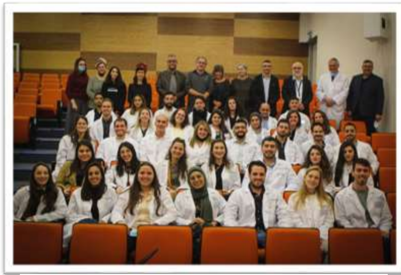
Three-Year Track White Coat Ceremony

כ"ו שבט – ט' אדר א' התשפ"ב January 28 – February 10, 2022